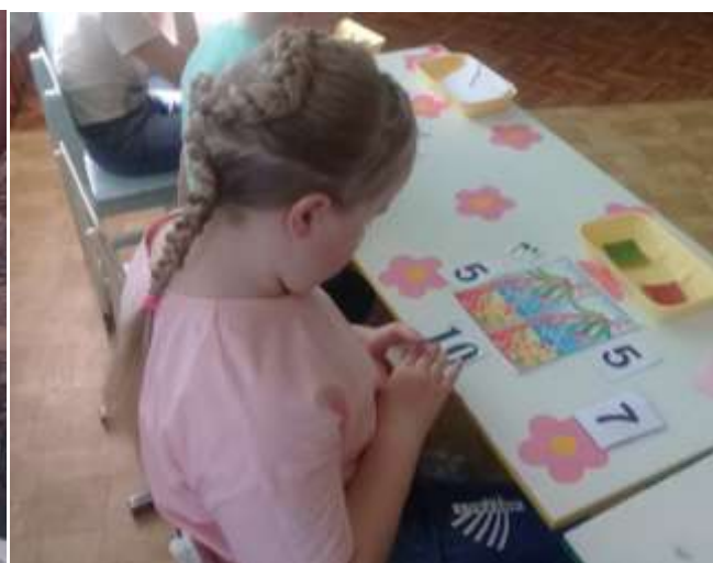
Дети выполняют задание.