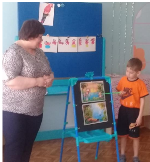
Составление рассказов детьми.