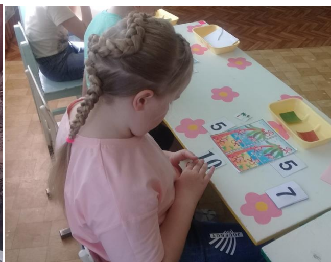
Дети выполняют задание.