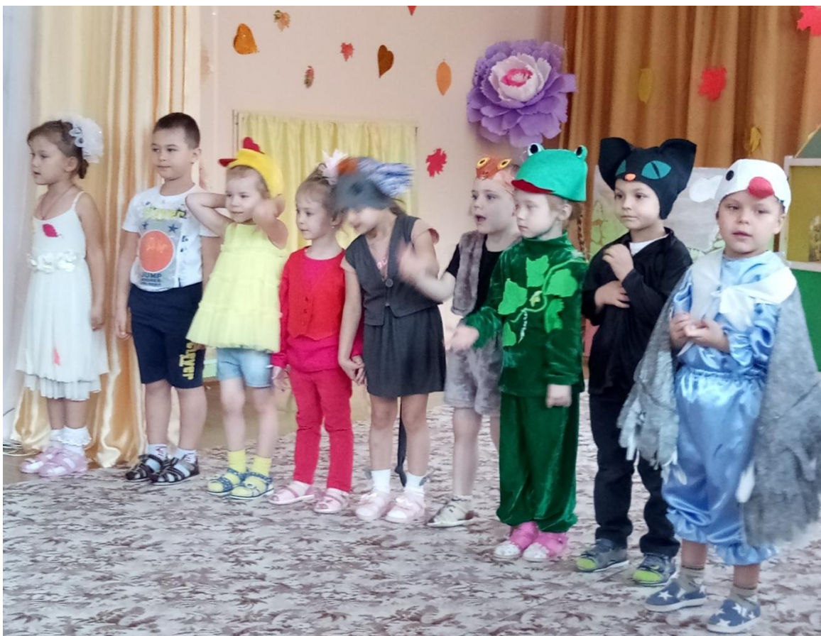
Песенка «Мои друзья»