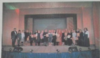
Поэтический вечер «мы о войне стихами говорим»

В наше время, когда жизнь наполнена бесконечными трудностями, проблемами и заботами, хочется чего-то особенного – светлого и доброго. И вот это особенное создает работница культуры. Несдаром говорят, что культработники – это люди, без которых «сказала» бы планета и счастье было бы неполным.