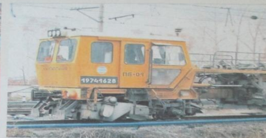
Путевые машины на ремонте.

Хочу рассказать о важной профессии – железнодорожник. Это же название для всех, кто работает на железной дороге. Мой